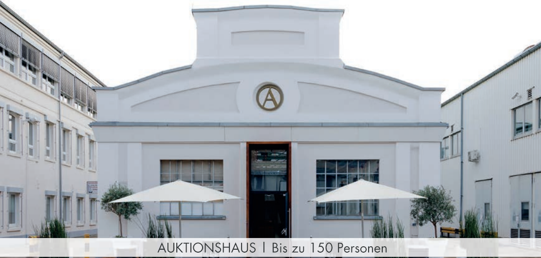
AUKTIONSHAUS | Bis zu 150 Personen